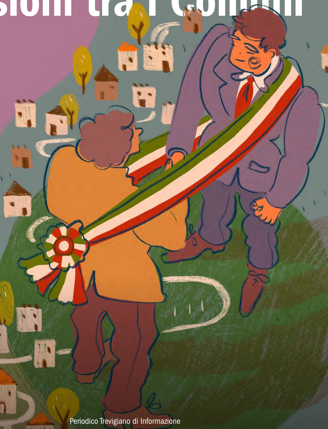
Illustrazione di Caterino Favaro