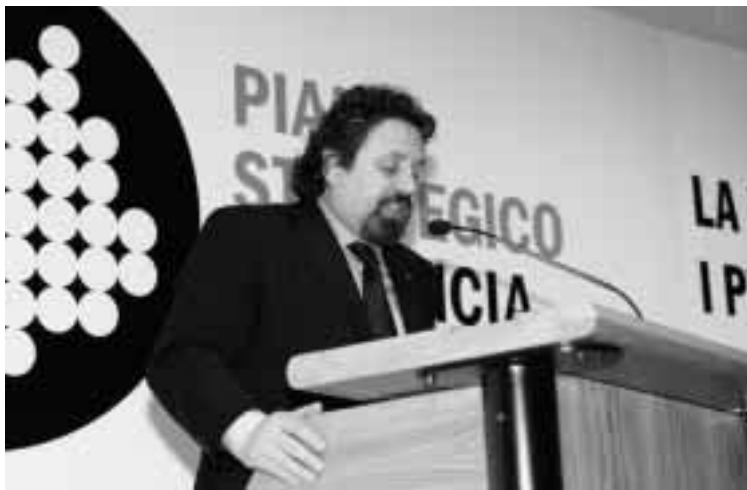
L'intervento di Paolino Barbiero, segretario generale della Cgil