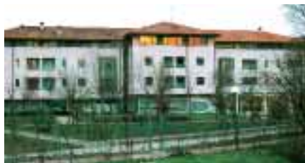
Casa di riposo di Silea

Sono altre le scelte che la Regione può e deve fare. Bisogna che la Giunta del Veneto, in attesa della creazione di un fondo nazionale di sostegno alla non-autosufficienza, da subito dia avvio ad un fondo integrativo regionale che si assuma completamente quella parte di costo delle rette relative alle maggiori necessità che i non autosufficienti richiedono. Aiutare le famiglie, assicurare una vecchiaia dignitosa anche ai meno fortunati, questo il compito di una società moderna.